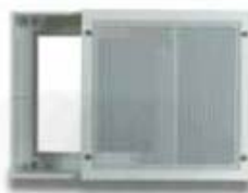
8. Sofdistri Exhaust