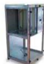
5. FC - Filter Casing