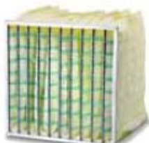
2. S-Flo F7