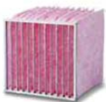
1. Hi Flo F7