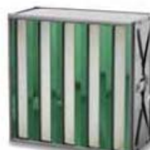
4. Sofilair H13