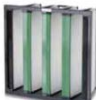
3. Opakfil F8