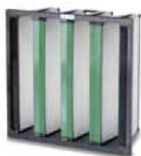
2. Opakfil Green