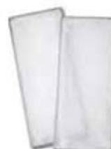
9. Fan Coil Filter