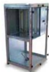
14. FC - Filter Casing