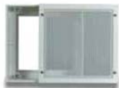
11. Sofdistri Exhaust