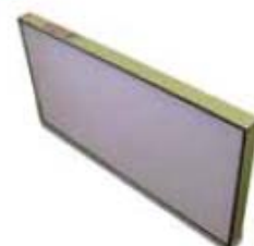
10. Megalam Green