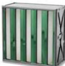
3. Soflair H13