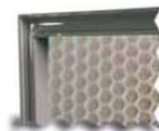
5. Megalam T "U"