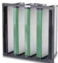
2. Opakfil Green F7