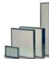
15. Ecopleat F6